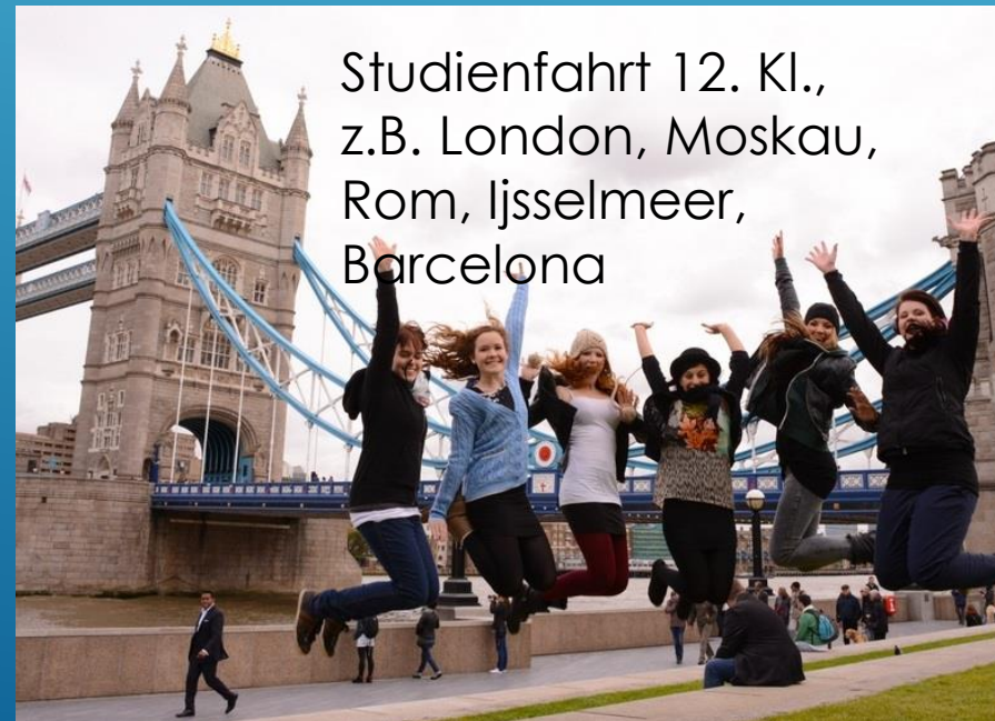
Studienfahrt 12. Kl., z.B. London, Moskau, Rom, Ijsselmeer, Barcelona