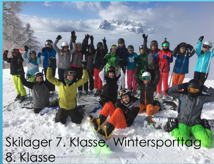
Skilager 7. Klasse, Wintersporttag 8. Klasse