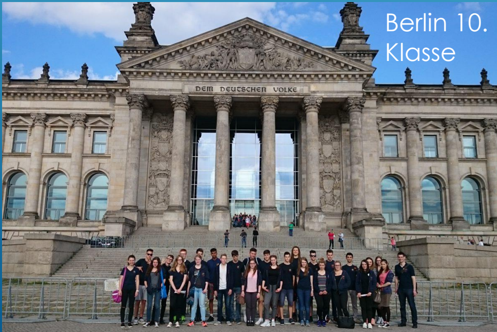
Berlin 10. Klasse