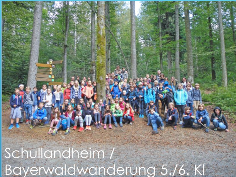
Schullandheim / Bayerwaldwanderung 5./6. Kl